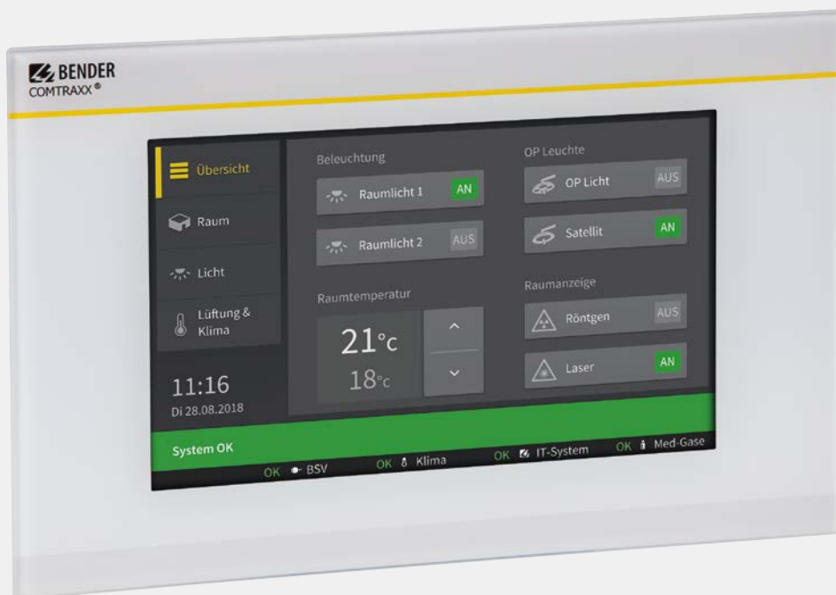
Tableau de commande et de signalisation pour les locaux à usage médical et d'autres secteurs